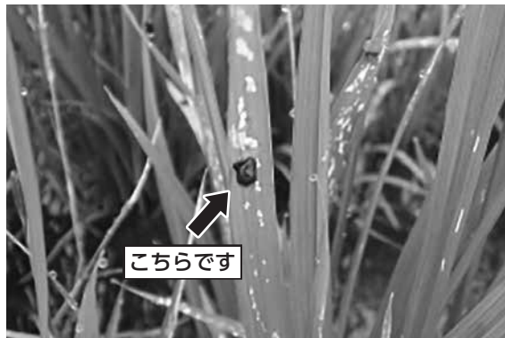
イネクビソノハムシ

に、この名が付いています。日が昇ると、泥負虫は稲の根元に降りていくので、朝露の残る早朝に、稲を食べる泥負虫を舟形網ですくって集めることで駆除しました。」