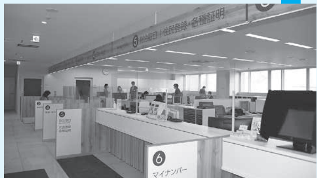
手続きの窓口は1階に集約しました