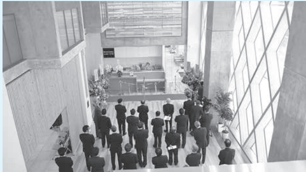
工事関係者など28人が参加