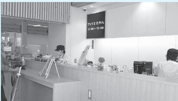
ホールにあるカフェでコーヒーをどうぞ