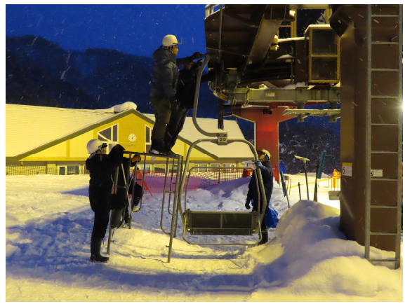
リフト定期整備（定期実施）の様子