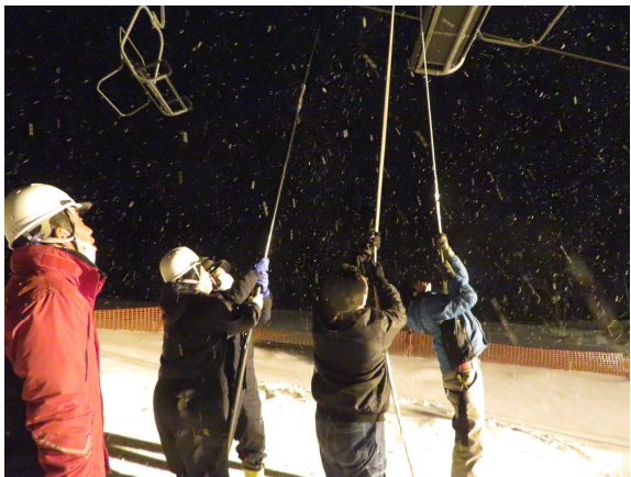
リフト救助訓練の様子