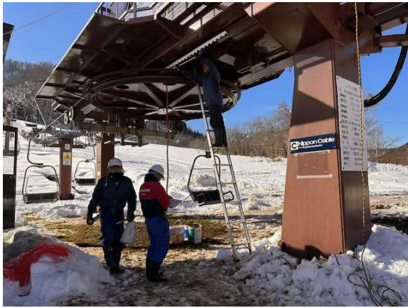
オープン前リフト検査（12ヶ月検査）の様子