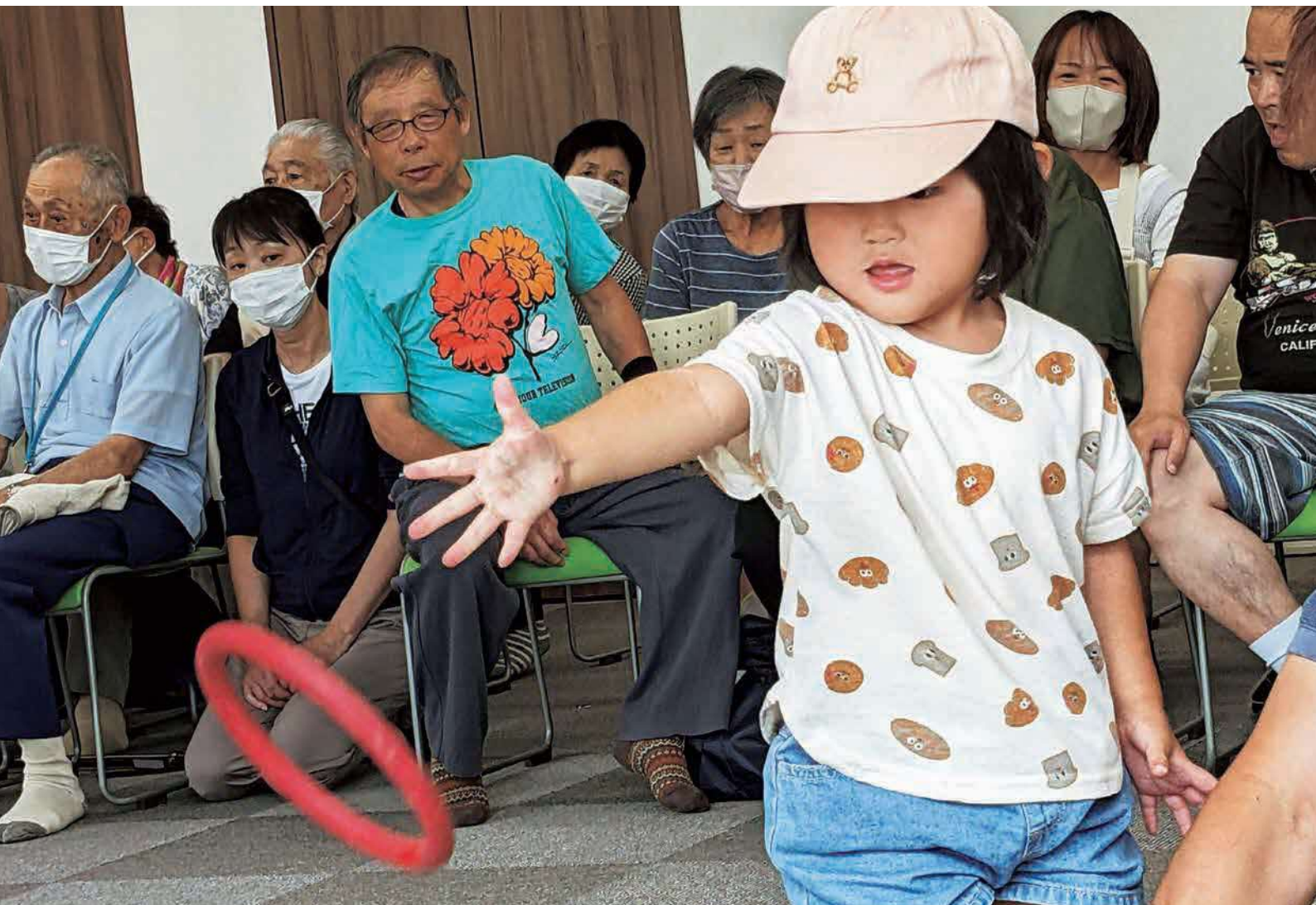
えいっ！入って！（文京区民レクリエーション）