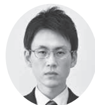
加藤 敏晃 議員

答 私でも構わないし、分野が明らかかなものであれば担当部署でも構わない。議員からも我々に橋渡しをして、機運を高めてほしい。我々もそういう声を傾聴し、共有させてほしい。