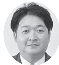
大島 光敬 議員

※ガバメントクラウドファンディングとは…全ての寄附がふるさと納税の対象となる、自治体が行うクラウドファンディングのこと。