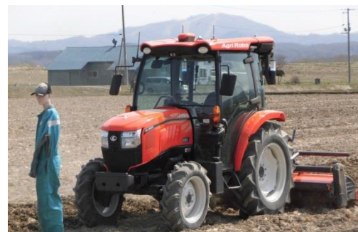
ロボットトラクタ実演会（H31.4.29）