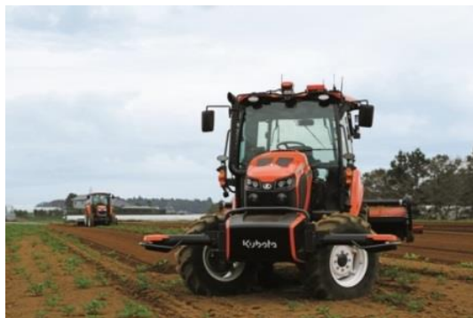
アグリロボトラクタMR1000A（無人）