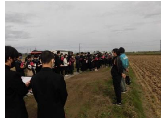
中学生スマート農業機械現地見学会・試乗体験の様子（R3.10実施）