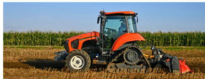
アグリロボトラクタMR1000A（有人）