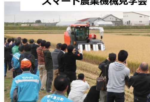
自動運転コンバイン実演会（R1.10.7）