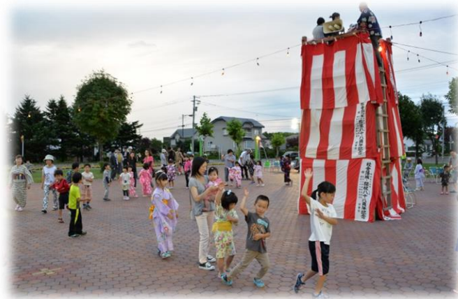
行政区主催の納涼祭

町民が主体的にまちづくりや地域づくりに参加する機会が、住民活動の活性化につながることから、行政区活動支援交付金の事業数とします。