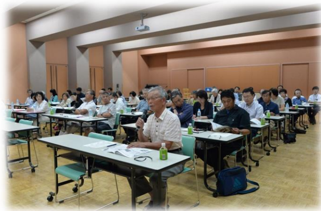
まちづくり懇談会