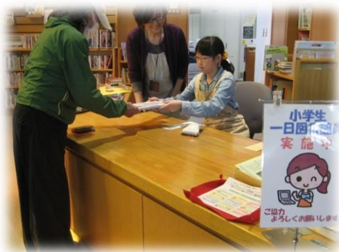
図書館員 1 日体験