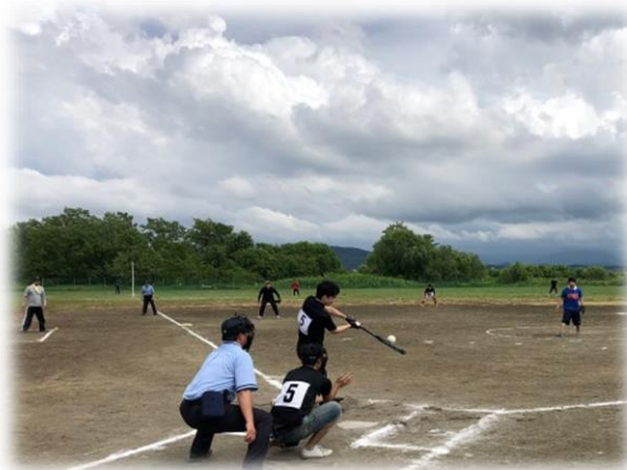
全町ソフトボール大会