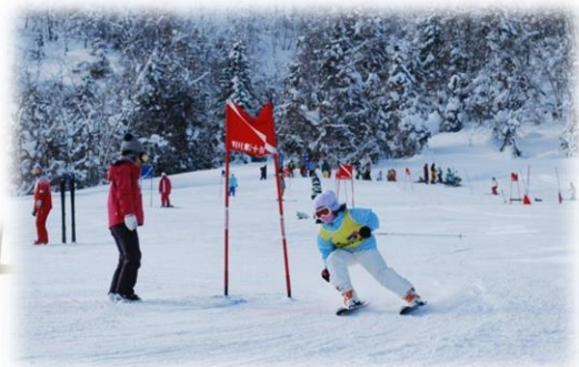
そっち岳スキー大会