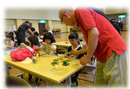
とっぷ子どもゆめクラブ