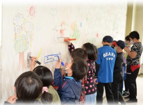
旧庁舎での「役場で遊ぼう」 (子ども会主催)