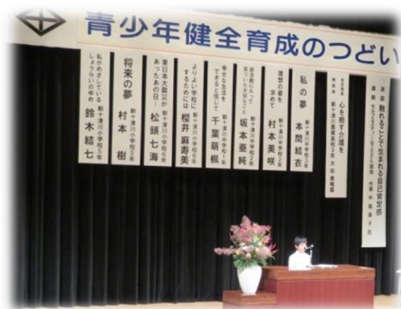
青少年健全育成のつどい