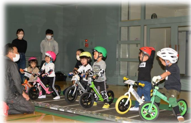
ランニングバイク体験会 (スポーツクラブ主催)