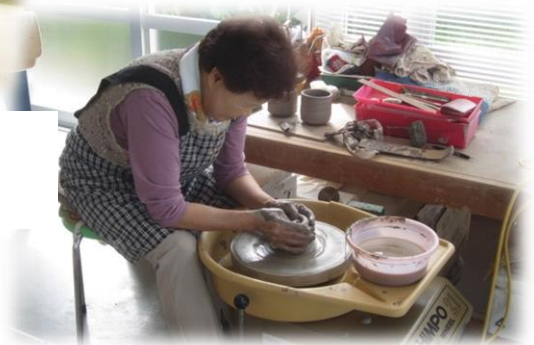
ゆめりあ部会（陶芸部会）