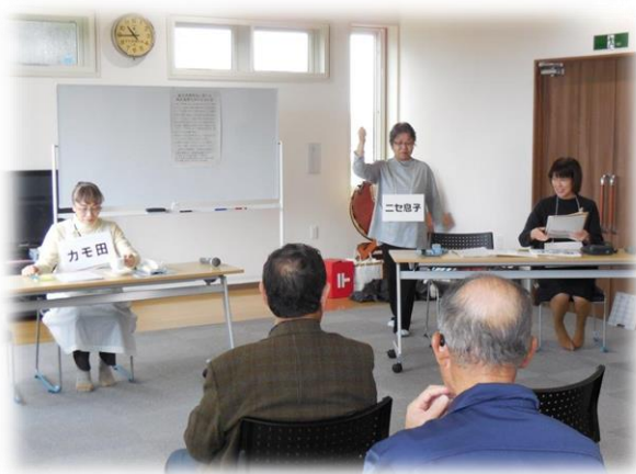
レインボー講座（賢い消費者になるために）