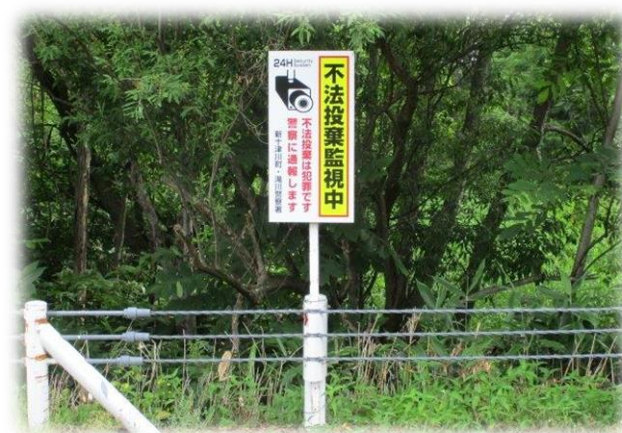
不法投棄禁止啓発看板