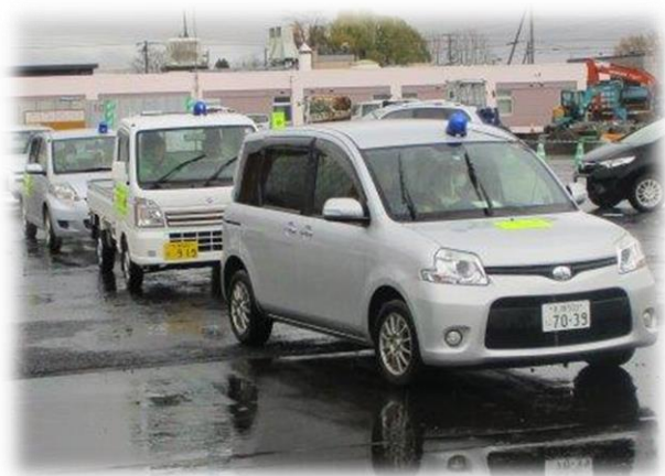
自主防犯パトロール

犯罪を未然に防ぎ、安全で住みよい地域の実現を図ることから、青色回転灯防犯パトロール実施回数（延べ回数）とします。