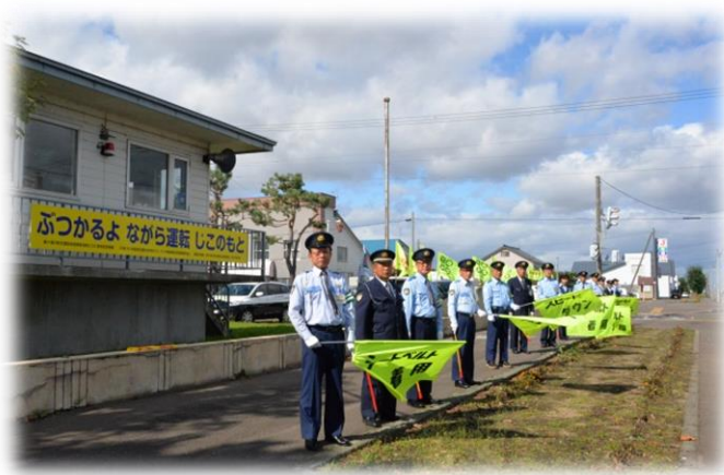
交通安全指導員による指導啓発