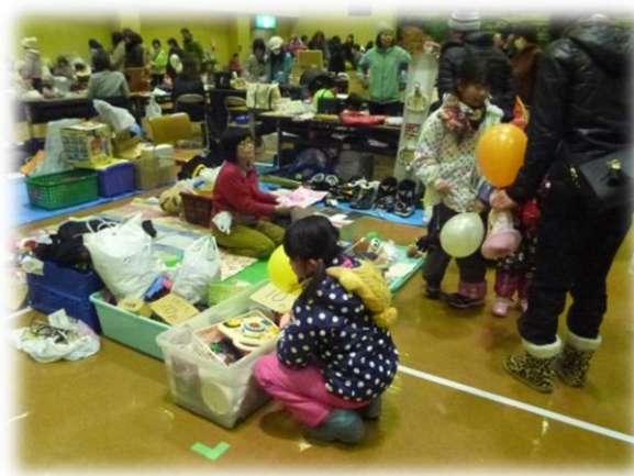
リユースショップ