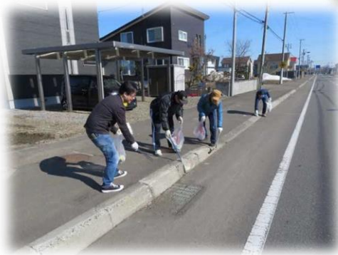
町内団体によるボランティアごみ拾い