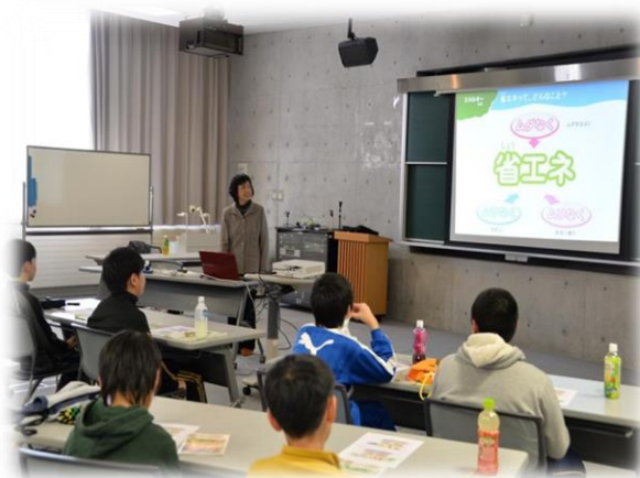
子ども会リーダー研修会環境学習