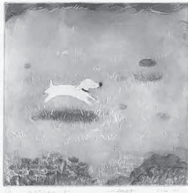
作品名 「日当たりのよい日」

半年ごとの入れ替えで、2月〜8月の作品を展示しています。新進気鋭の芸術家による作品を、ぜひご鑑賞ください。