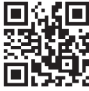
△しんとつかわ音頭体操