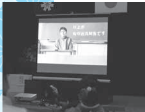
▲中学校時代の担任からのビデオレターの様子