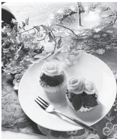
△あんクラフトのケーキ

個人の活動としては、6月にJSAあんフラワー・あんクラフト認定講師資格を取得し、10月から6回にわたりあんクラフト（あんの生地を使って作るデコ