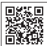
西空知広域水道企業団