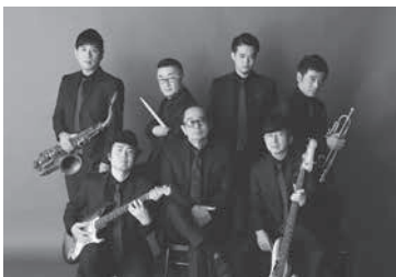
大野雄二 & ルパンティックシックス