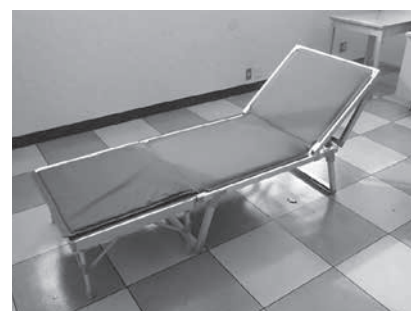
多目的簡易ベッド100台

そのほかに、非接触式体温計、フェイスガード、想定避難者約2,600人分のおおむね3日分に当たる使い捨てマスク、ポリエプロン、ポリ手袋、ハンドソープ、アルコール手指消毒液などを備蓄しています。