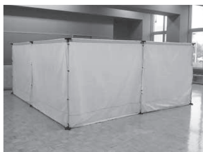
災害避難所用間仕切り4部屋セット（130セット）