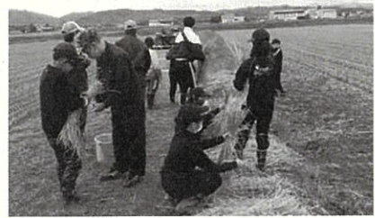
小学5年生の稲刈り体験の講師は、農業高校生や土地改良区の皆さん