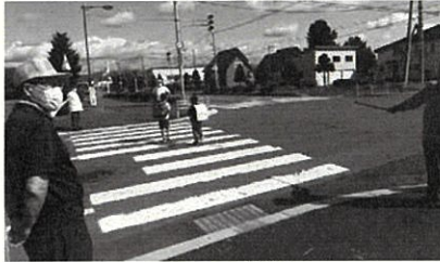
各団体の下校時の立哨（見守り）が、今年度は3回実施