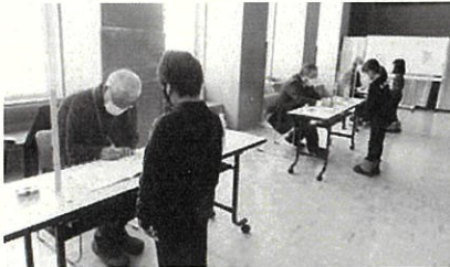
「やまびこ」講師は、とっぴ子どもゆめクラブ、保護者の皆さん

小中学校は、平成30年に町学校運営協議会を設立し、コミュニティ・スクールとして学校と地域が協力して子どもたちを健やかに育む取り組みを行っています。個人や団体、企業の皆さんが、学校での教育支援や安全対策、環境整備に携わり、地域で子どもたちを育てる基盤となっています。今年度の主な活動を紹介します。