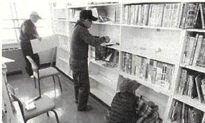
ゆめりあ木好苦楽部の皆さんが、小学校図書室の書棚を修理