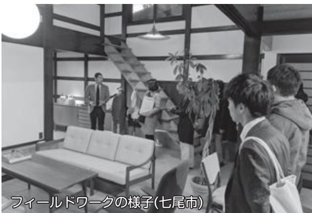
フィールドワークの様子(七尾市)