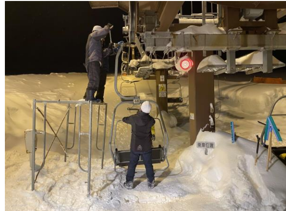
リフト定期整備（定期実施）の様子