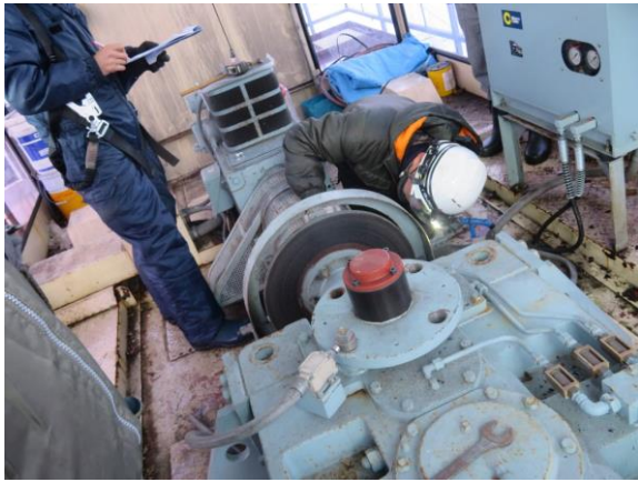
オープン前リフト検査（12ヶ月検査）の様子