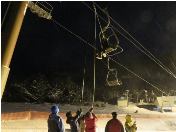
リフト救助訓練の様子