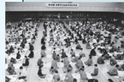
スポーツセンター