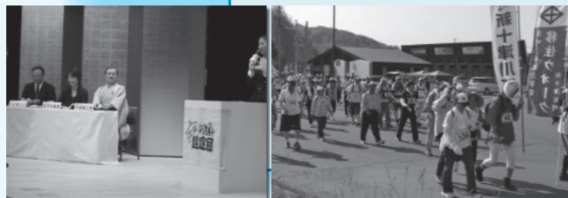
三笠の道の駅~町までの36km