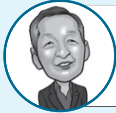
白石 昇 議員