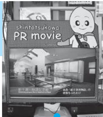
PR動画 町の魅力を紹介します 札沼線DVDのダイジェスト版も放映中