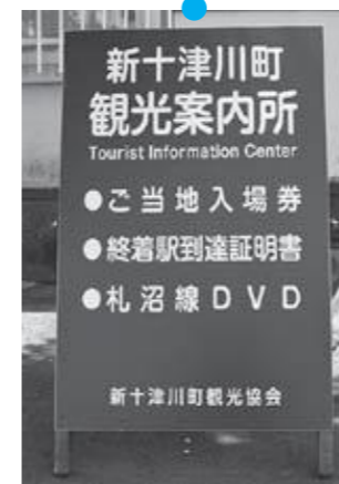
案内所看板 紺色の看板が 営業中の目印です