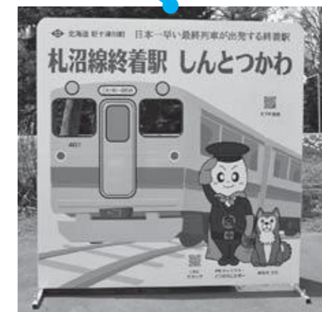
顔出しパネル 記念撮影にどうぞ