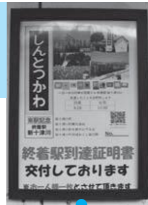
終着駅到達証明書 訪れた記念に1枚無料で発行します