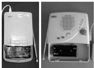
電池ケースを開けたところ