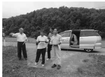
農地の状況を確認する農業委員

今回の法改正は、現農業委員の任期が終了する来年7月の改選に伴う、農業委員の募集、任命から適用となります。