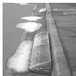
段差解消ブロック