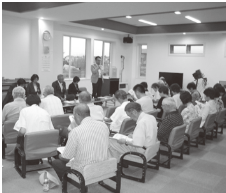
議会報告会での議会活動説明

広報広聴常任委員会の誕生後、初の議会報告会が7月6日の花月区を皮切りにスタート。全行政区で合計175人の方に参加いただきました。 〈主な話題〉 今回の議会報告会では、行政区ごとにテーマを設定し地域特性に応じた情報交換を実施しました。 農村地域と市街地域では、地域の抱える課題や住民の思いに違いがあり、テーマを設定したことで情報交換がより活発に行われました。