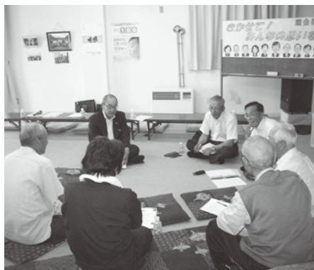
議会報告会での意見交換

〈課題〉 話しやすい環境づくりのため、昨年引き続き、「車座方式」で実施しましたが、昨年(182人)と比べて参加者は若干少ない状況でした。 また、女性の参加者が全体の2割を下回っており、PRの方法などに工夫が必要と感じました。