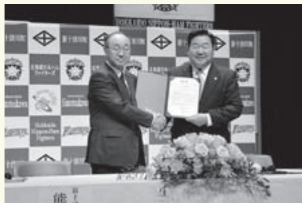
パートナー協定調印式