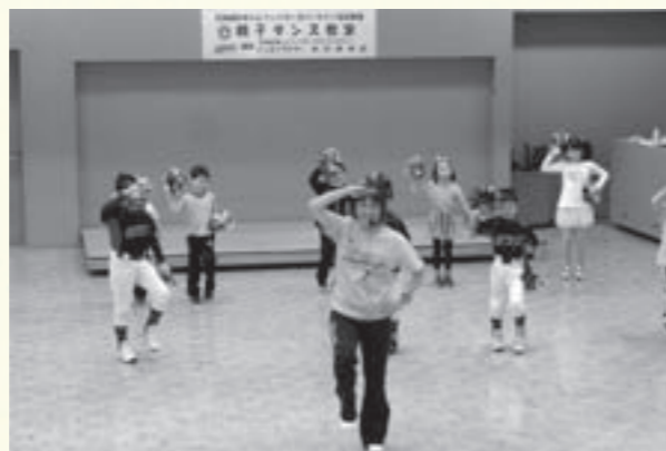
小学生ダンス教室