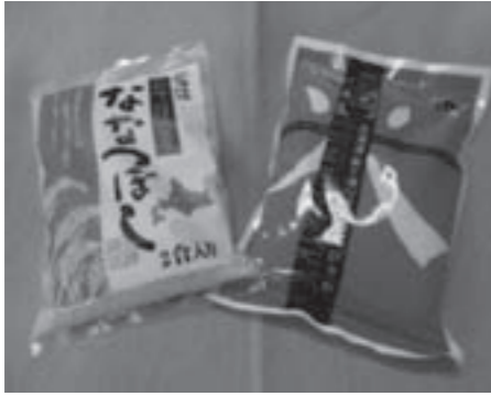
▲達成者には新米2合を2袋進呈します。

場所 ゆめりあ事務所窓口 時間 平日の午前8時45分～午後5時30分 締切 10月30日(金) ※記念品の引渡しは11月2日(月)～20日(金)です。