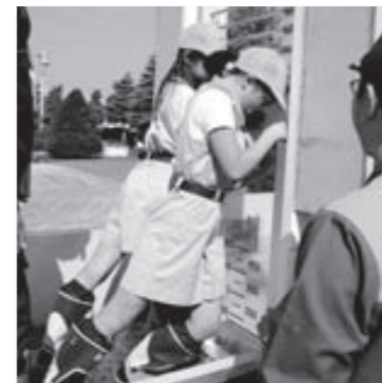
△地下浸水体験 「40cmでドアが開かないよ～」