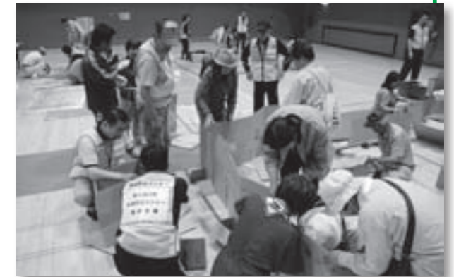
△ダンボールで簡易間仕切りの作成