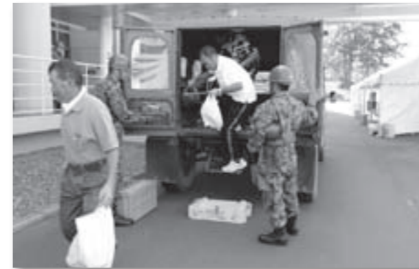
△自衛隊車両による移送訓練

329人（うち避難住民189人）が参加し、避難所の開設や避難所までの移送訓練、避難所体験や消火体験、アルファ米の作成、赤十字奉仕団によるカレーの炊出し、道防災ヘリによる吊り上げ救助の見学などを行い、防災意識を高めました。