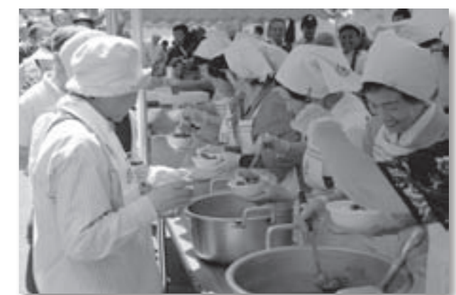
△赤十字奉仕団によるカレーの炊出し