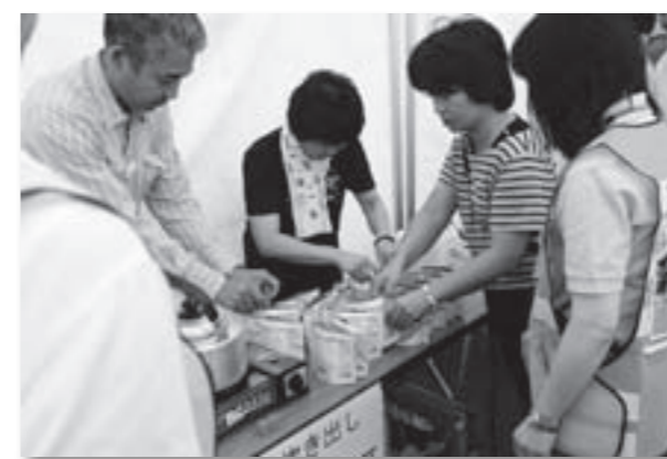
△アルファ米の作成