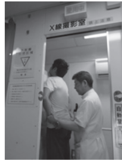
肺がん検診(X線撮影)

今年まだ健診を受けていない方も間に合います。9月1日(火)から、秋の集団健診(11月14日、15日に実施)の申し込みをスタートします。詳細は9月号でお知らせします。病気を予防するために健康診断を受けましょう!!