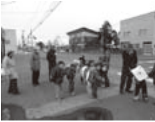
▲元気よくあいさつする新1年生