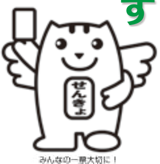
みんなの一票大切に！

今年4年に一度の統一地方選挙の年です。私たちの町や地域の方針を決め、私たちの暮らしにつながる大切な選挙です。