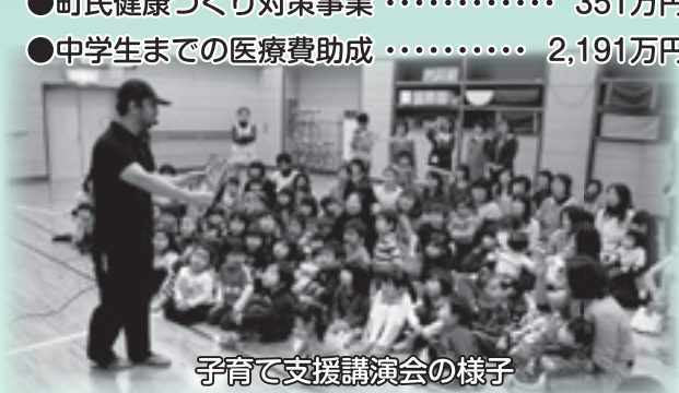
子育て支援講演会の様子