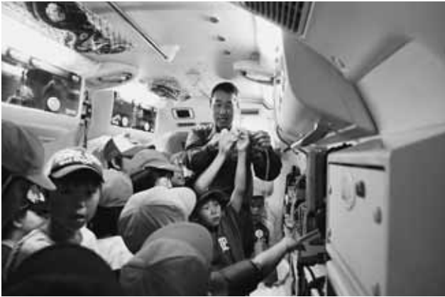
小学4年生が救急車を見学 (9/3)