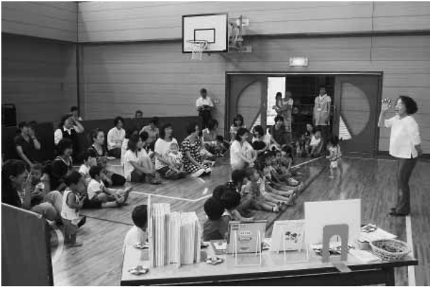
ぴよぴよきっずスペシャル「わらべ歌遊び」(7/30)