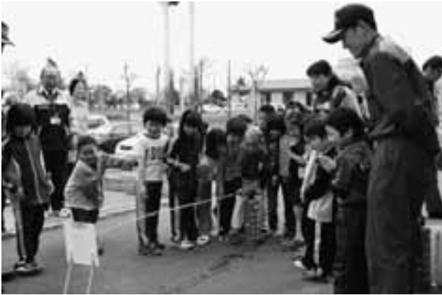
児童館で避難訓練 (5/21)

保健福祉課 ☎72-2000 建設課 ☎76-2139 住民課 ☎76-2130 議会事務局 ☎76-3191 総務課 ☎76-2131 会計課 ☎76-3192 産業振興課 ☎76-2134 教育委員会 ☎76-4233 農業委員会 ☎76-2135