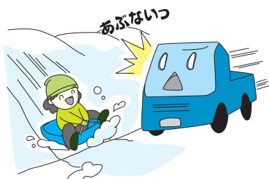
道路でのそり遊びはやめましょう

道路の除雪作業により住宅間口が塞がる、あるいは段差ができることがあります。住宅敷地の除雪は各家庭で行ってください。