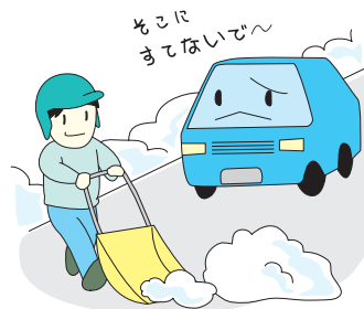
道路への雪出しはやめましょう

道路の雪山でスキー、そり遊びは交通事故につながります。道路周辺でのスキー、そり遊びは絶対にやめましょう。