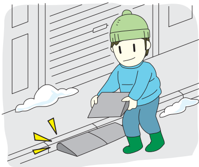
段差解消ステップは移動しましょう

縁石の段差解消ステップやゴミ搬出用のカゴなどが歩道や路肩に置いてあると見られます。作業中に除雪車で破損させてしまった場合でも補償することはできませんので、早急に移動してください。