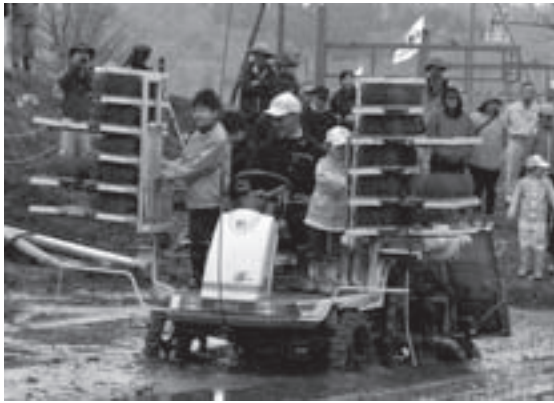
今年1回目の田んぼの学校 (5・22)