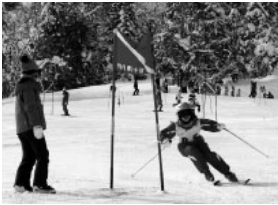
第5回そっち岳スキー大会 (2・19)