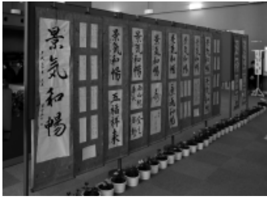
ゆめりあ書道部会作品展 (ゆめりあ)

保健福祉課 ☎72-2000 建設課 ☎76-2139 住民課 ☎76-2130 議会事務局 ☎76-3191 総務課 ☎76-2131 会計課 ☎76-3192 産業振興課 ☎76-2134 教育委員会 ☎76-4233 農業委員会 ☎76-2135