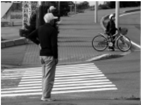
▷安全パトロール(9・29)

今年も子どもたちの健やかな成長を願って青少年健全育成町民会議の活動を進めていきますので皆さまの温かいご支援とご協力を賜りますようお願い申し上げます。