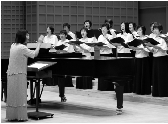
アザレアコーラス定期演奏会 (11・19ゆめりあ)