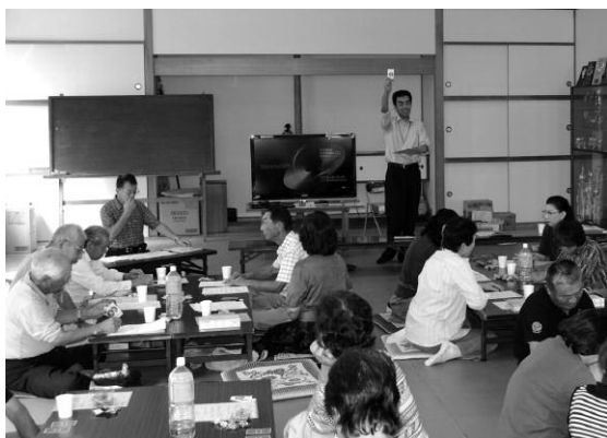
レインボー講座「防災喫茶」 (9・1橋本区)