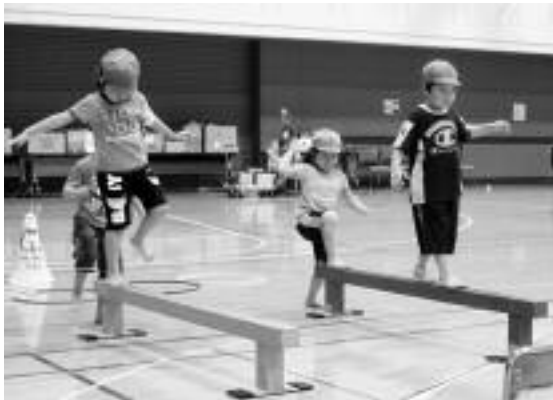
新十津川保育園運動会(6・25)

保健福祉課 ☎72-2000 建設課 ☎76-2139 住民課 ☎76-2130 議会事務局 ☎76-3191 総務課 ☎76-2131 会計課 ☎76-3192 産業振興課 ☎76-2134 教育委員会 ☎76-4233 農業委員会 ☎76-2135