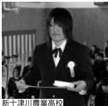
新十津川農業高校