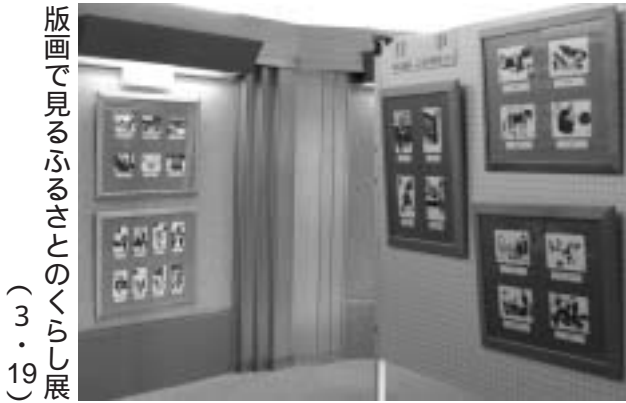
版画で見るふるさとのくらし展 (3・19)

保健福祉課 ☎72-2000 建設課 ☎76-2139 住民課 ☎76-2130 議会事務局 ☎76-3191 総務課 ☎76-2131 会計課 ☎76-3192 産業振興課 ☎76-2134 教育委員会 ☎76-4233 農業委員会 ☎76-2135