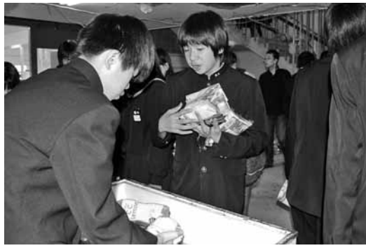
新中学校祭のバザー (10・23)

保健福祉課 ☎72-2000 建設課 ☎76-2139 住民課 ☎76-2130 議会事務局 ☎76-3191 総務課 ☎76-2131 会計課 ☎76-3192 産業振興課 ☎76-2134 教育委員会 ☎76-4233 農業委員会 ☎76-2135