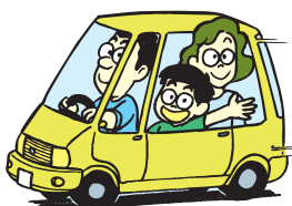
自動車の燃料として 再資源化 126ℓ