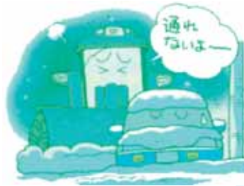
除雪の妨げになる路上駐車はやめましょう

路上駐車は、除雪作業の支障となり、吹雪や夜間など視界不良のときには事故の原因となります。やむを得ず駐車しなければならぬ場合は、役場へ連絡し、公共施設への駐車への指示を受けてください。公共施設への無断駐車はご遠慮ください。 違法駐車を見つけた場合は警察に通報します。