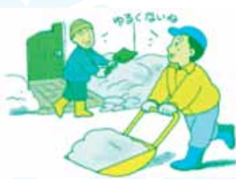
除雪後の玄関前の雪処理はご家庭で

道路の除雪作業で玄関前がふさがり、あるいは段差ができることがあります。玄関前を含む間口の除雪は各家庭でお願いします。