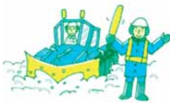
除雪作業中は危険です

作業中の除雪車は、近づくると危険ですので、近寄らないでください。運転中の方も除雪車の近くを走行するときは十分に気を付けてください。