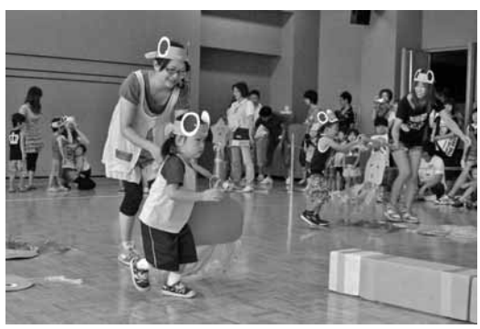
子育てスクール運動会 (8・28)

保健福祉課 ☎72-2000 建設課 ☎76-2139 住民課 ☎76-2130 議会事務局 ☎76-3191 総務課 ☎76-2131 会計課 ☎76-3192 産業振興課 ☎76-2134 教育委員会 ☎76-4233 農業委員会 ☎76-2135