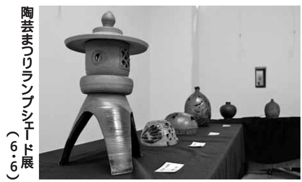
陶芸まつりランブシエード展 (6・6)

保健福祉課 ☎72-2000 建設課 ☎76-2139 住民課 ☎76-2130 議会事務局 ☎76-3191 総務課 ☎76-2131 会計課 ☎76-3192 産業振興課 ☎76-2134 教育委員会 ☎76-4233 農業委員会 ☎76-2135