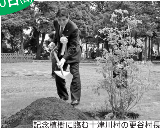
記念植樹に臨む十津川村の更谷村長