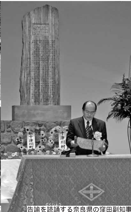
告諭を讀誦する奈良県の窪田副知事

戦没者・開拓物故功労者・消防殉職者追悼式と開町120年記念式典が、ゆめりあで開催され、追悼式に179人、記念式典に340人が参列しました。記念式典には、十津川村の更谷慈禧村長をはじめ、窪田修奈良県副知事、多田健一郎北海道副知事、鉢呂吉雄衆議院議員、橋本聖子参議院議員など多数の来賓も参列し、式典は厳肅な雰囲気の中で執り行われました。