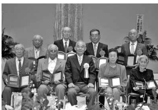
感謝状受賞者と植田町長