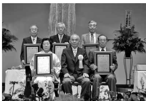
功労表彰・貢献表彰受彰者と植田町長