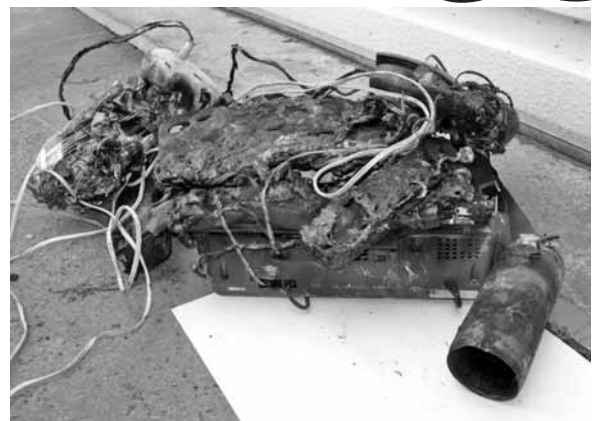
収集中に破裂し発火したスプレー缶（右手前）と引火した燃やせないごみ（5月11日）

⚠️ 注意 スプレー缶やカセットコンロ缶は、中身を使い切り、穴を開けてガス抜きをしてください。収集作業中に缶が破裂して火災が発生しています。