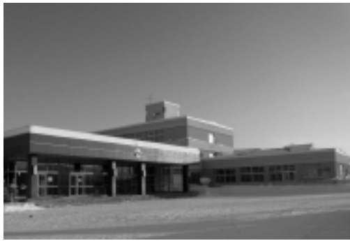
▷平成23年度に改修を予定する新十津川小学校