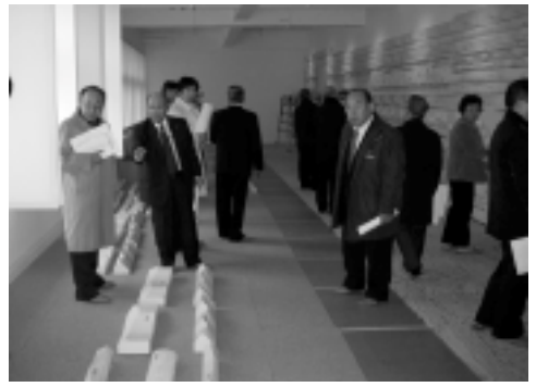
▷改修中の旧吉野小学校