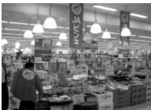
▷奈良県アピタ大和郡山店

本町農産物の販売促進活動の一環として、大阪、奈良で開催されたピンネフェア(大阪市の市場関係者が主催するJAピンネ取扱農産物販売促進活動)に新十津川町農産物ブランド化推進協議会から6名が参加し、本町の農産物等をPRした。