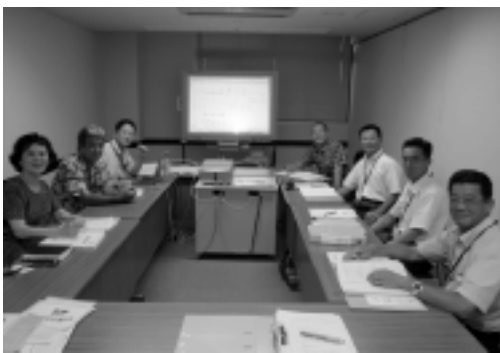
▷夜間のグループ演習

● 機関委任事務 ● 知事や市町村長を国の機関とし、上級行政庁としての指揮監督の下、国の事務を市町村などに委任して執行させる仕組み。