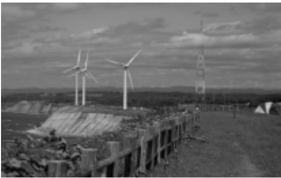
▷ 苫前町にある風力発電施設