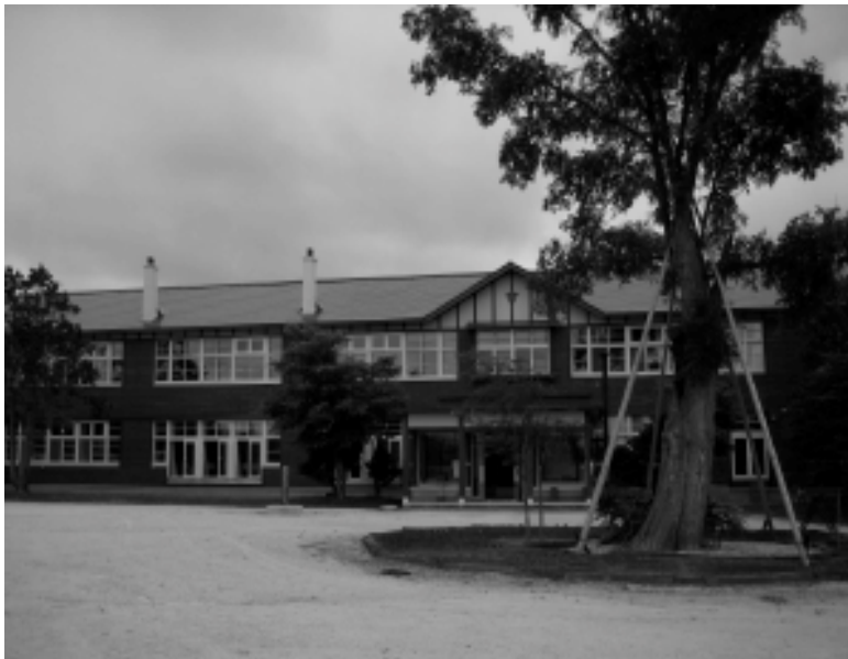
△コカ・コーラ環境ハウスとして再生した栗山町旧雨煙別小学校

道内最古の二階建て木造建築校舎として平成10年まで利用されていた雨煙別小学校跡地利用を視察した。