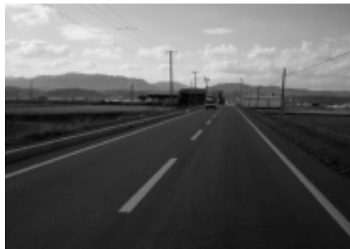
▷工事が完了した南7号線