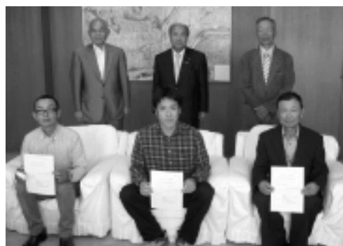
▷推奨書交付式(7月9日)

・JAPINネ女性部の協力により、産地直売朝市が毎週土曜日にJAPINネストア前で開催。店内にも常設「もぎたて市コーナー」を設けている。