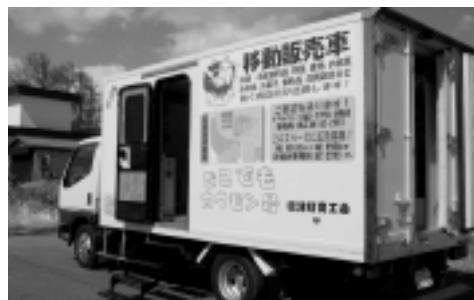
標津町商工会の移動販売車(今年4月)

質問 本町の高齢化比率は32%まで進み、幌加地区のように限界集落もできている。また、近年農村部では、JAの店舗が撤退したり、採算が合わない商店が廃業に追い込まれた現状もあり買い物難民といわれる事態が起きてくると考えられる。